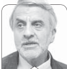
سیدمصطفی هاشمی طبا

نگاهی به سازمان محیط زیست، هیئت دولت و محیط زیست ایران در طول ۴۰ سال گذشته نشان می‌دهد نه سازمان محیط زیست به‌ وظایف ذاتی و مکتوب خود آگاه است، نه دولت‌ها این سازمان و نیز اصل محیط زیست را باور دارند و نه محیط زیست ایران و مردمی که از آن فیض می‌برند، روند ثابت و پایداری داشته است.